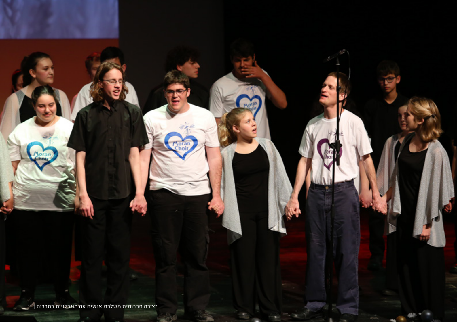
יצירה תרבותית משלבת אנשים עם מוגבלויות בתרבות | 11